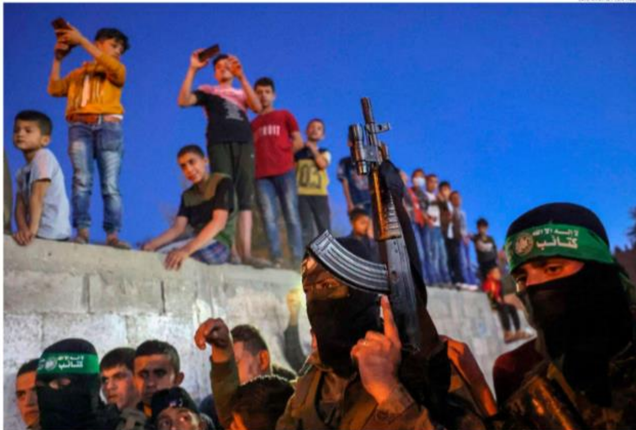
Videot kriisialueilta ovat nousseet pinnalle TikTok-sovelluksessa ja keränneet yleensä ympäri maailmaa. Kuvassa lapset kuvaavat kahden taistelijan hautajaisia Gazassa toukokuussa 2021.

– Tällaisissa tilanteissa kuvat ja videot saavat uuden merkityk- sen. Jos ne leviävät, se voi olla