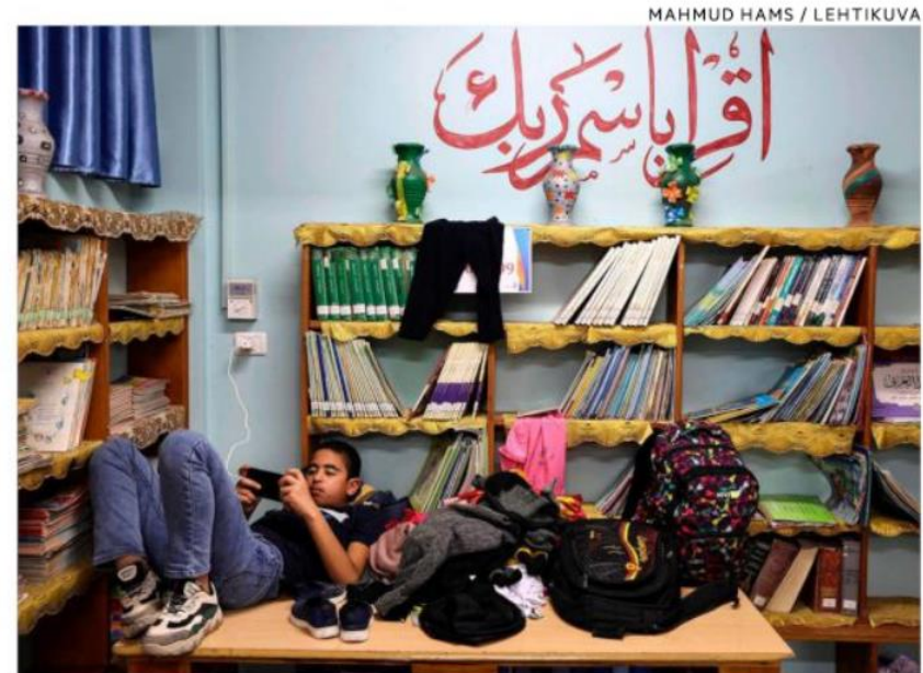
Palestiinalainen nuori pelaa puhelimellaan suojarakennuksena toimivassa koulussa Gazassa. Tiktok-somepalvelussa on ollut myös nuorten pitämiä livelähetyksiä sota-alueilta, esimerkiksi toukokuun aikana Gazasta.

Hänen mukaansa on mahdollonta sanoa yksittäisen tapauksen kohdalla, onko kyse pelkästään järjestelmähäiriöstä vai jos-